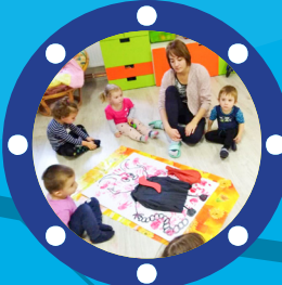
Cílová skupina Rodiny s dětmi