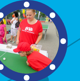
Cílová skupina Děti a mladí dospělí do 20 let