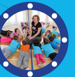
Cílová skupina Rodiny s dětmi

Rodinné centrum Sluníčko je služba poskytovaná v Prachaticích od roku 2007. Jejím cílem je umožňovat osobám pečujícím o děti ve věku do 6 let pravidelná společná setkávání, v jejichž rámci mají možnost účastnit se nejrůznějších aktivit zaměřených jak na svůj rozvoj osobnosti tak svých dětí, aktivní odpočinek a relaxaci.