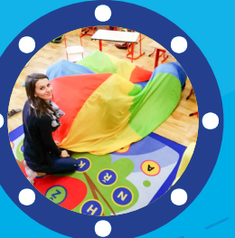
Cílová skupina Žáci a studenti jihočeských škol