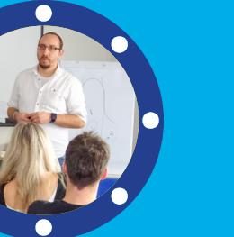
Cílová skupina Děti a mladí dospělí do 20 let