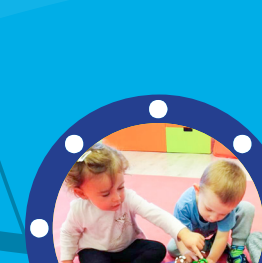
Cílová skupina Rodiny s dětmi