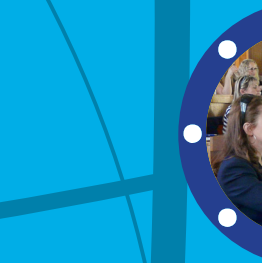
Cílová skupina Děti, pedagogové, sociální pracovníci a veřejnost (především rodiče)